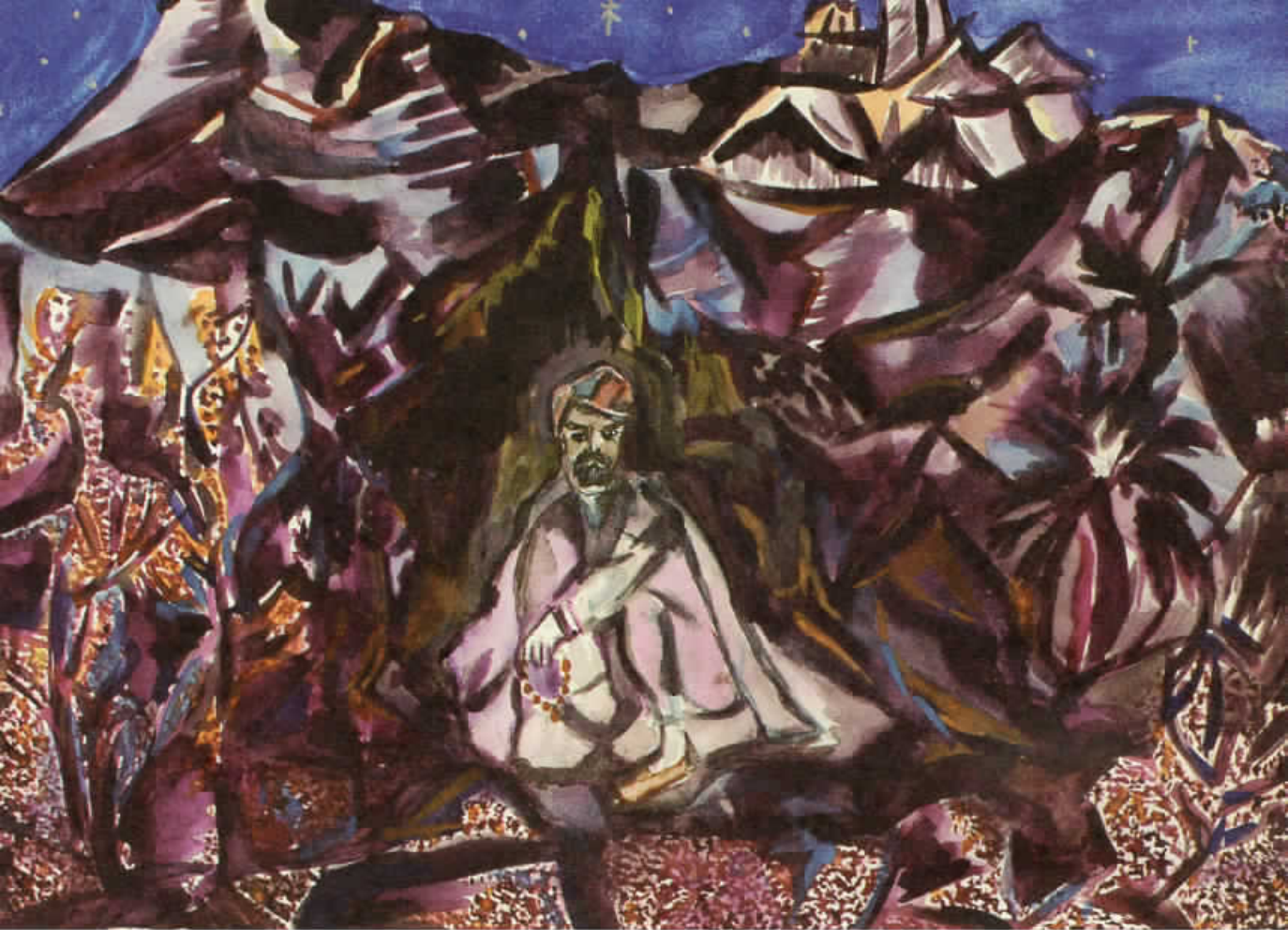
“Бедреддин в пещерата”