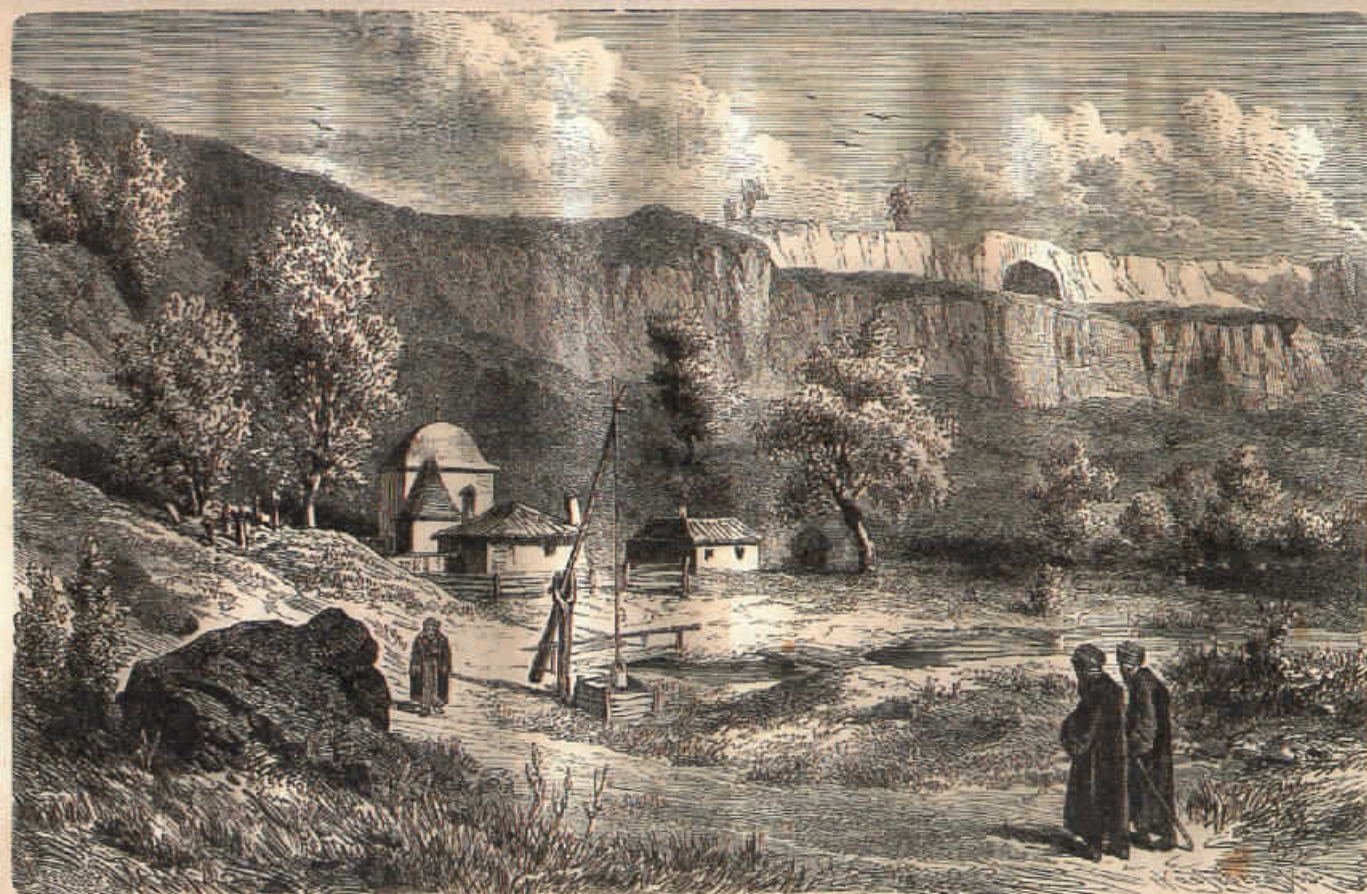
ТЕКЕТО ДЕМИР-БАБА - ПЕХЛИВАН

и журналист към списание "Illustrirte Zeitung", Лайпциг. Съчинението му "Дунавска България и Балкана" придобива огромна популярност и по думите на видния френски общественик Луи Леже сред всички други произведения "... това най-правдоподобно представя историческото и културно значение на България". Фактът, че книгите му са преиздавани многократно на немски, френски и руски още в края на XIX и в началото на XX век, говори за световния интерес към автора и проблематиката, която той разглежда.