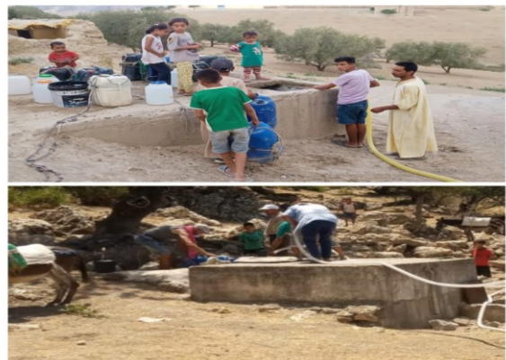
الاهتمام بملف الماء