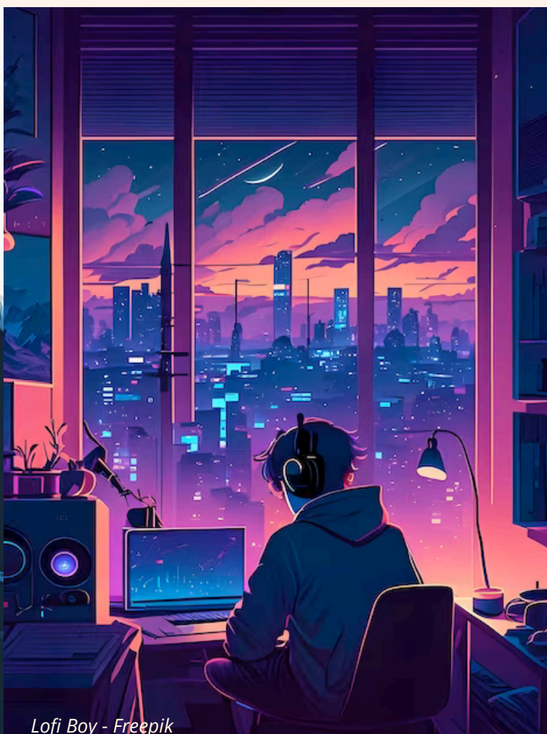
Lofi Boy